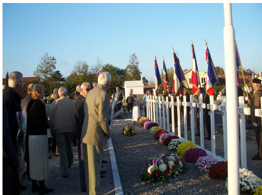
Cérémonie du 1er novembre 2007 au carré militaire de Capbreton

de celles et de ceux qui sont morts pour la France ou qui l'ont honorée par leurs actions.