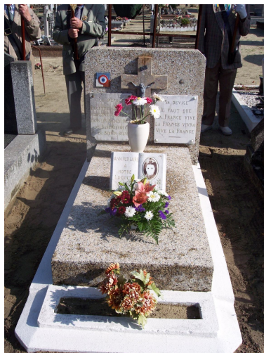
Tombe de Lucette Moreau à Labouheyre restaurée en 2007.

des tombes et des monuments élevés à leur gloire.