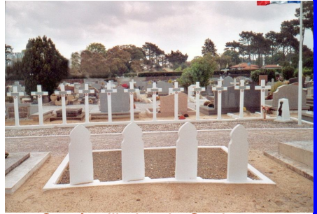
Carré militaire de Capbreton

D'autres ouvrages nous attendent à court terme compte tenu de l'érosion du temps et des mentalités.